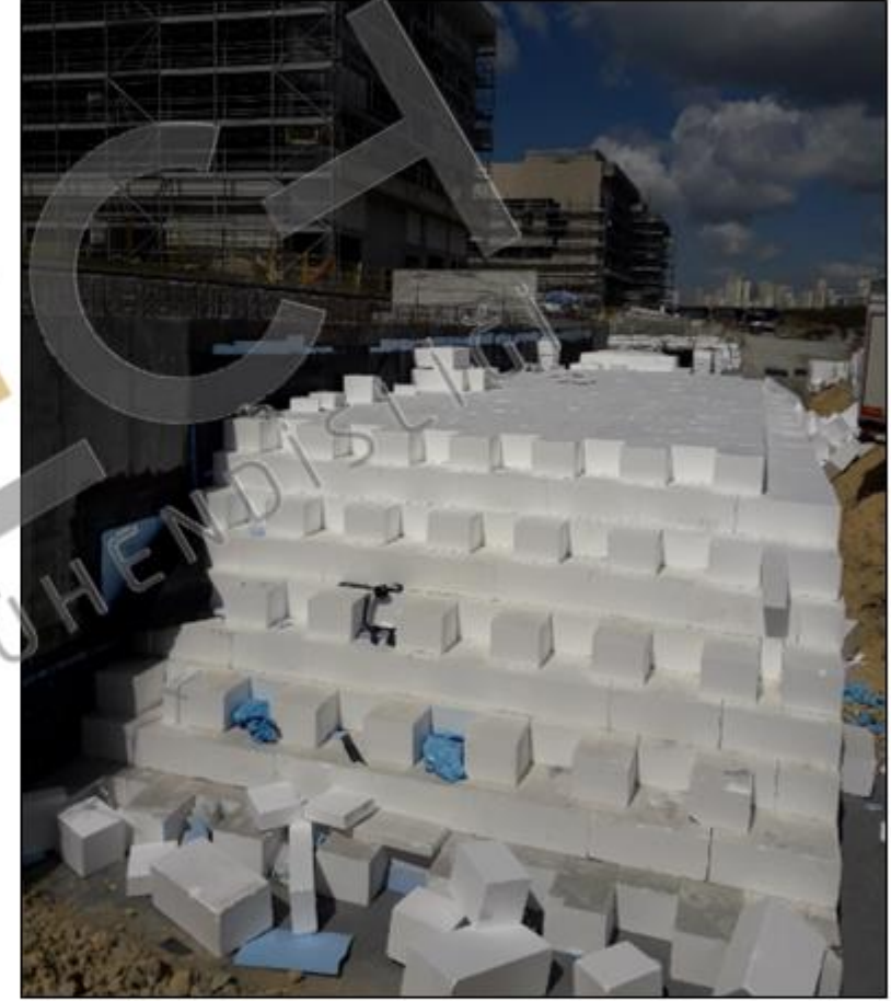
Geofoam blokların yerleşimi