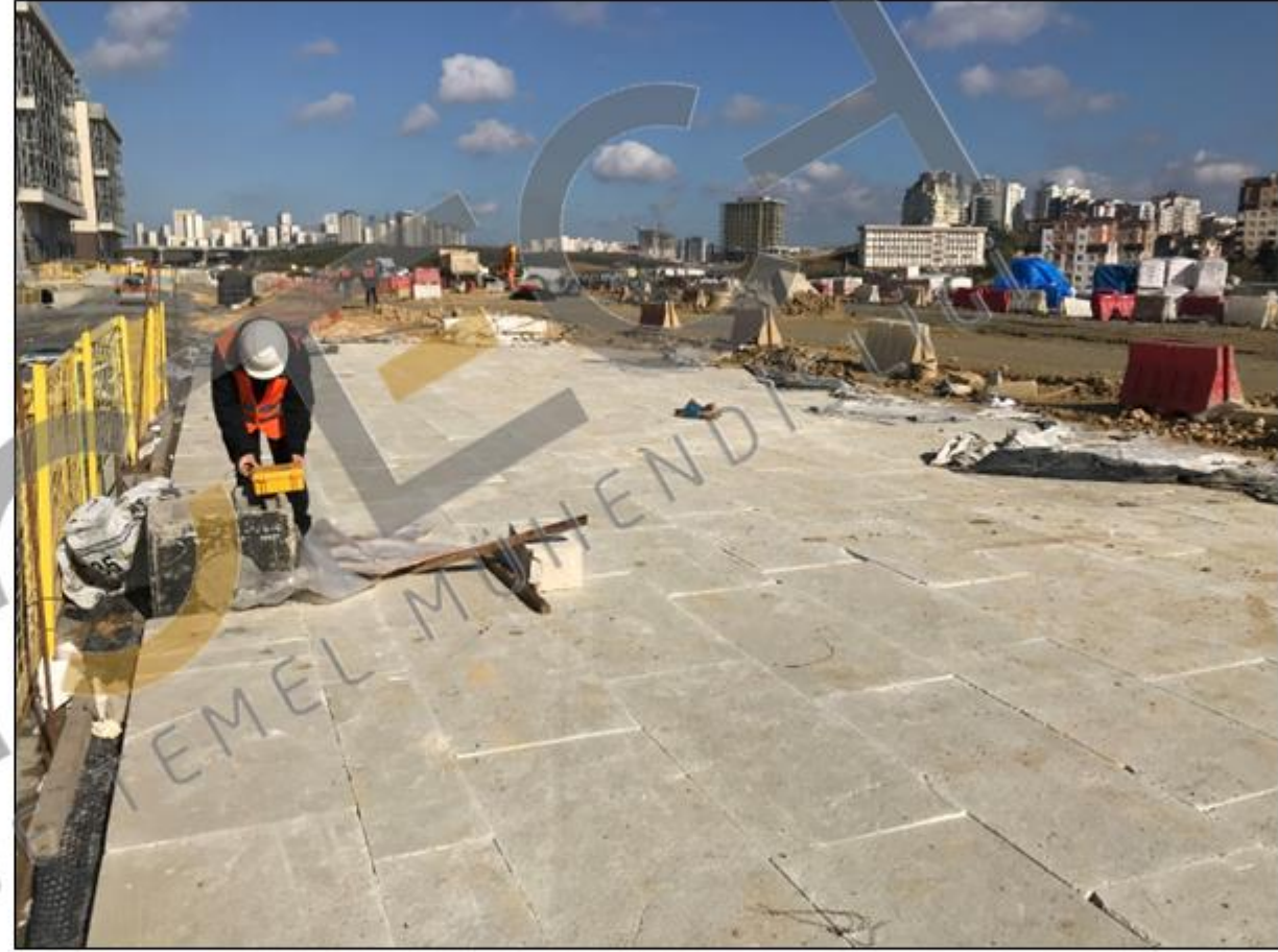
Basınç hücresi enstrümantasyon istasyonu kurulması (Otopark perdesine)