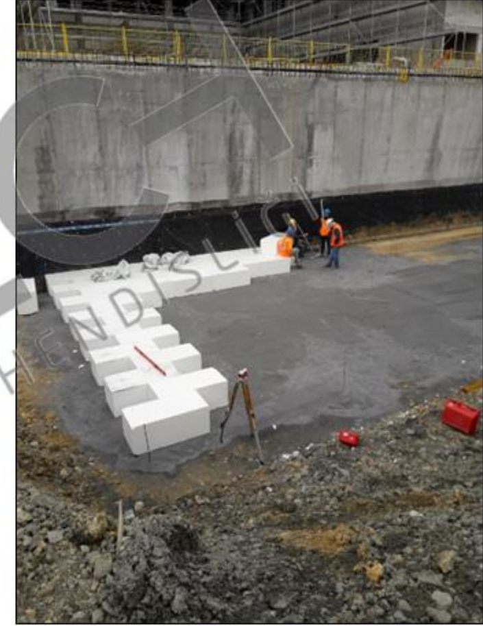
ZEMİN VE TEMEL MÜHENDİSLİĞİ Geofoam blokların yerleşimi