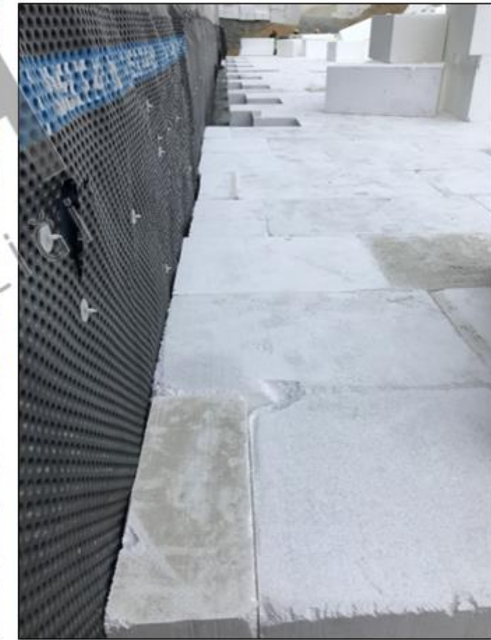
Geofoam blokların yerleşimi (Sahada özel kesim işçiliği)