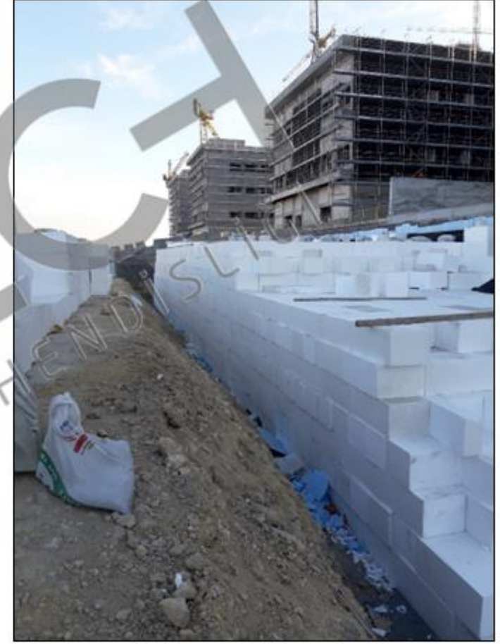
Geofoam blokların yerleşimi