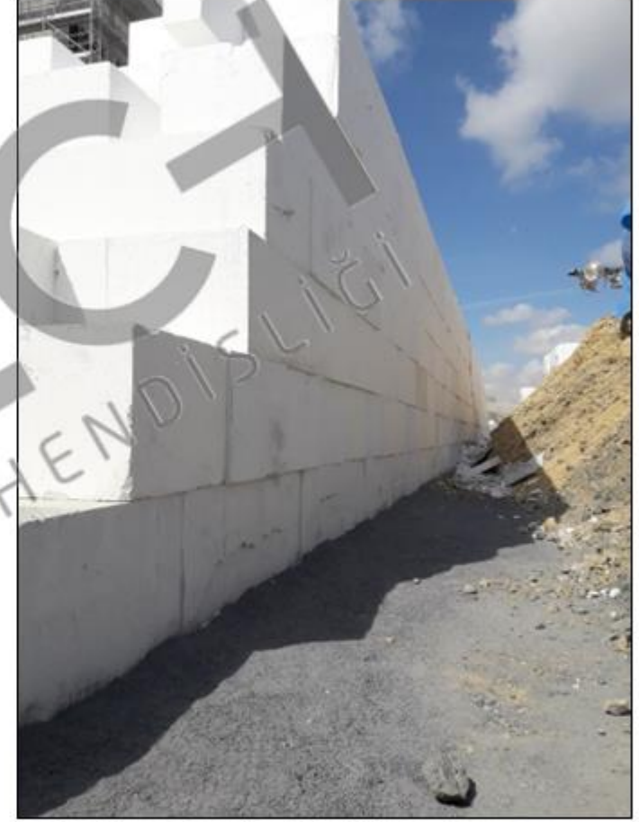
ZEMİN VE TEMEL MÜHENDİSLİĞİ Geofoam blokların yerleşimi