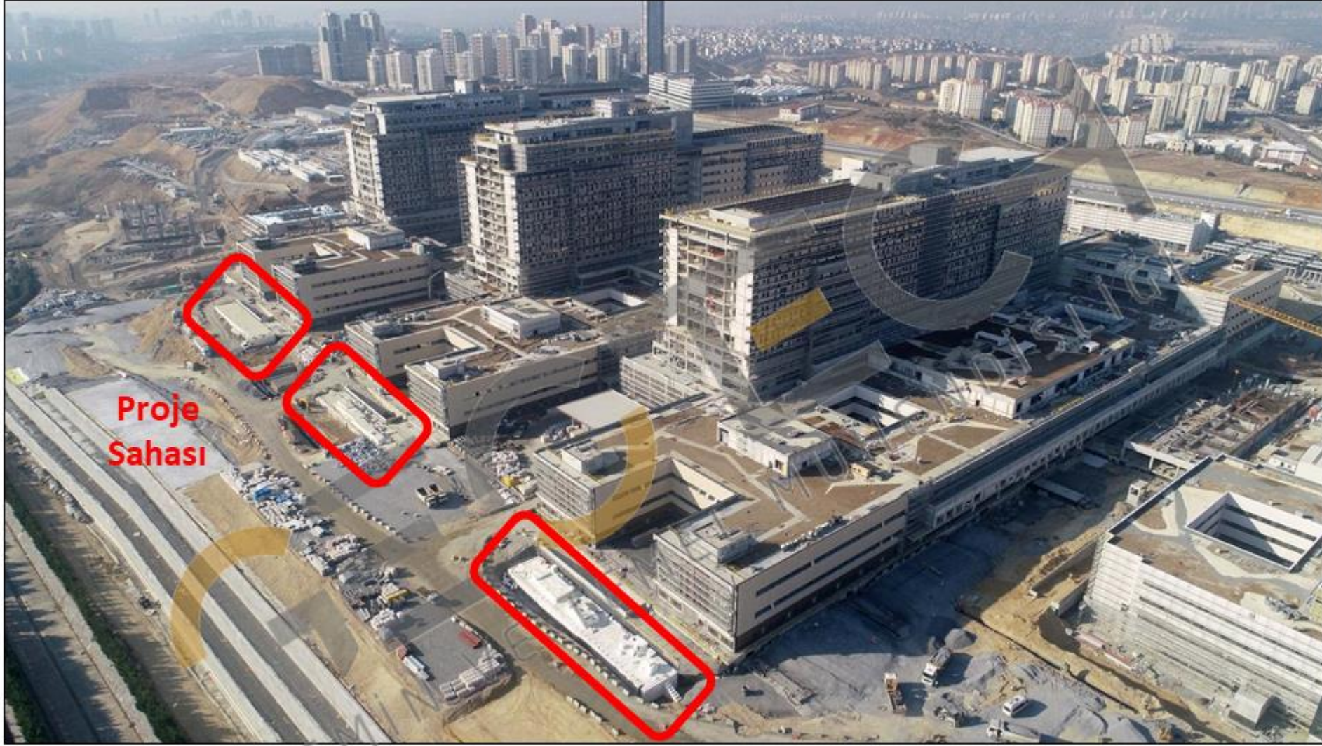
Proje sahasının konumu