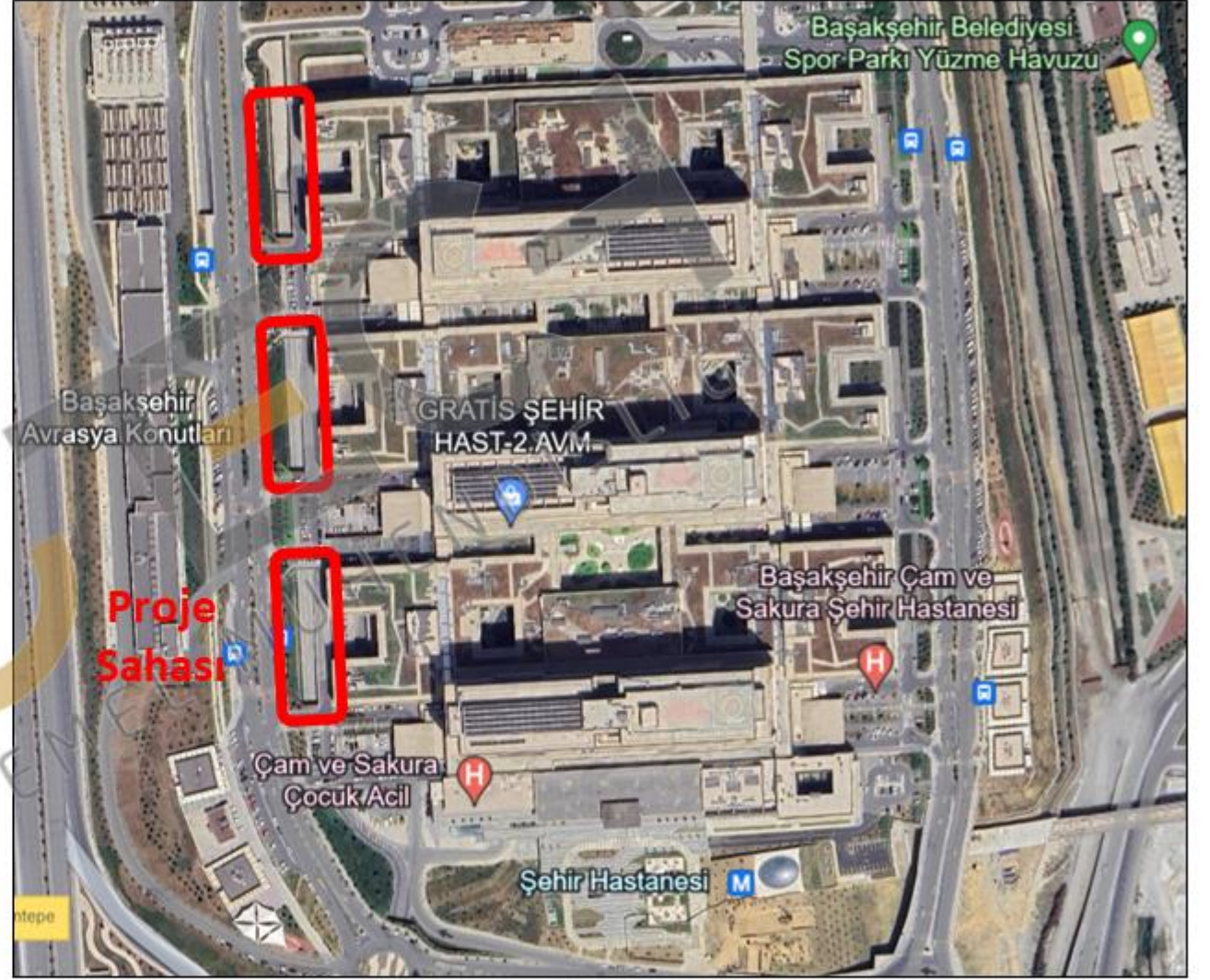
Proje sahasının konumu